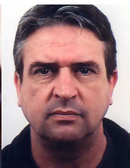
Philippe GUYOMARC'H Communication